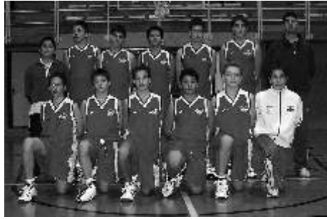
CBP ALONSO BERRUGUETE Categoría: PREINFANTIL MASC. 3º Clasificado